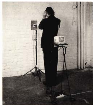
C. Ciervo "Udito" 1993

□ Si chiama Juan Leal-Ruiz il giovane artista sudamericano (Bogotà, 1965) rappresentante nazionale per la Colombia (presso l'Istituto Italo-Americano) alla Biennale di quest'anno. In anteprima, presso la GALLERIA CESARE MANZO , Leal-Ruiz propone i suoi ultimi lavori nella mostra "Il Sonno delle Ninfe", a cura di Giovanna dalla Chiesa . Negli spazi della Galleria Manzo , l'installazione "Nymphaceum" si presenta carica di