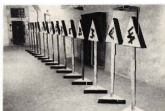
A. Cunoldi "Zeitfeur"

La vasta esposizione di Ugo Nespolo presso la Stamperia dell'Arancio , dal titolo "Stra-vedere" (sponsored dalla B.M.W.), ripropone la multiforme produzione - nota e recente - di un artista che occupa un posto a sé nel contesto contemporaneo. Nespolo, negli anni Sessanta, pur muovendosi nell'ambiente torinese dove maturavano le prime esperienze poveriste e concettuali, con le sue