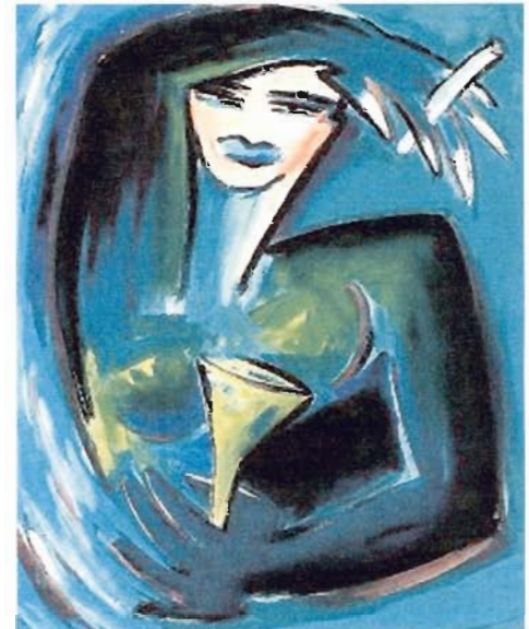
Elvira Bach: «Die Zigarette, jederzeit sie rette», 1985.