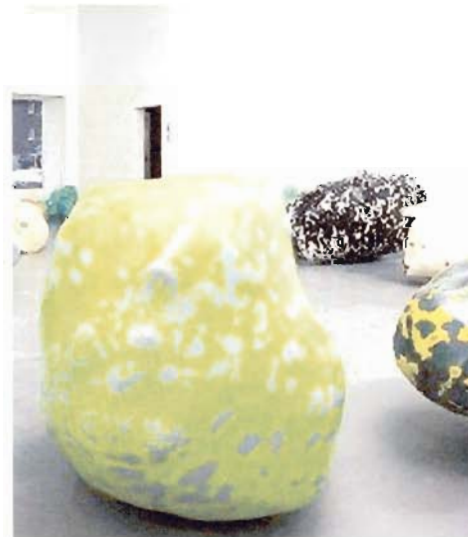
Wilhelm Mundt: «Trashstones» aus Abfall und Kunststoff.